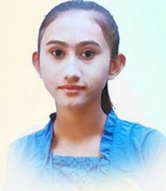
अपेक्षा वी. राजगोर धोरछा- ६