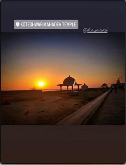
KOTESHWAR MAHADEV TEMPLE @d.a.jaiswal

નવી સવાર, નવા રંગ સાથે, સૂરજની માફક તેજોમય, નવી મોજ સાથે, નવી દિશા આપતી આજ ની નારી. ઉગતા સૂર્યની જેમ જગત ને પ્રકાશિત કરવા અને આથમતા સૂર્ય ની જેમ આ જગતને એક અનુભવ આપવા નીકળેલી એક નારી. મારા અને મારા પરિવાર વતી સર્વે ને મારા વંદે માતરમ્.