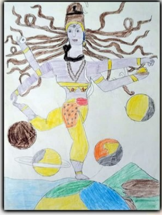
विधान कर्तव्यकुमार राजगोर धोरछा-प