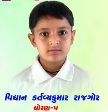
વિદ્યાન કર્તવ્યકુમાર રાજગોર ધોરણ-૫

મત છે મારો , આ જગતને , આ વડને ના કાપો, દેવ સમાન છે આ વૃક્ષ , તેની મર્યાદા રાખો. વડ સહિત બીજા વૃક્ષો , આવે ઘણા કામ , ના સમજો તેમને નકામાં , નહી તો પળમાં થશે નાશ. આ ધરતી લાગશે આપણને એક શૂળ જેવી , વૃક્ષોને કાપ્યાં તો સમજો , વરસાદ નહીં આપે સાદ. ભાઈઓ મારા, એક બીજો મત છે મારો, વૃક્ષોને નહીં વાવો તો , સૂરજની ગરમી દેશે ડામ. વૃક્ષોનાં જંગલ રહ્યાં નથી , બન્ય કોંક્રિટનાં જંગલ, માનવજાત સામે જંગ ખેલે છે, વૃક્ષોનું અસ્તિત્વ.