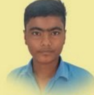
લય એ. સમૈયા ઘોરણ- ૯