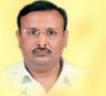
પી.જી. પ્રજાપતી ઉચ્ચ.માધ્યમિક શિક્ષક

વિશ્વમાં વંદનીય જો કોઈ વ્યક્તિ હોય તો તે છે જનની. 'જનની ની જોડ સખી નહિ જડે રે લોલ' . માટે જ કહેવાયું છે કે પુત્ર કુપુત્ર થાય પણ માતા કુમાતા ન થાય. અખૂટ વાત્સલ્યનું ઝરાણું એટલે માં. જીવનના તડકા છાયા વેઠી જે પોતાની જાતને ખપાવી દઈ સૌ ના કલ્યાણનો જ વિચાર કરે છે. માં ના આશીર્વાદ જો સાથે હોયતો દુનિયાની તમામ મુશ્કેલીઓ સામે લડી શકાય.