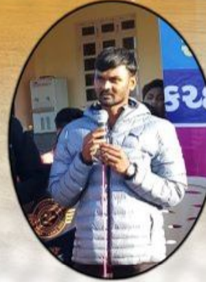
કચ્છમિત્ર - એકરવાલા ક્રિકેટ કપ