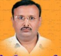
પી.વી. પ્રજાપતી ઉચ્ચ માધ્યમિક શિક્ષક

એક વખત વિવેકાનંદને અમેરિકામાં એક છોકરાએ કહ્યું, સાહેબ છાપું લ્યોને! સ્વામી વિવેકાનંદે કહ્યું : ' મારે છાપું લેવું નથી.'